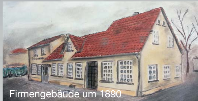
Firmengebäude um 1890

Individuelle Beratung und das flexible Reagieren auf Ihre Wünsche sind unser Maßstab, an dem wir uns messen lassen wollen. Hierzu gehört für uns die schnelle und qualitativ hochwertige Ausführung Ihrer Aufträge.